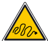
LE DANGER Des câbles au sol non protégés