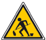
LE DANGER Sol humide