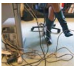
LE RISQUE Trébucher/chuter