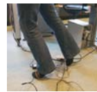
LE DOMMAGE L'accident en trébuchant sur les fils